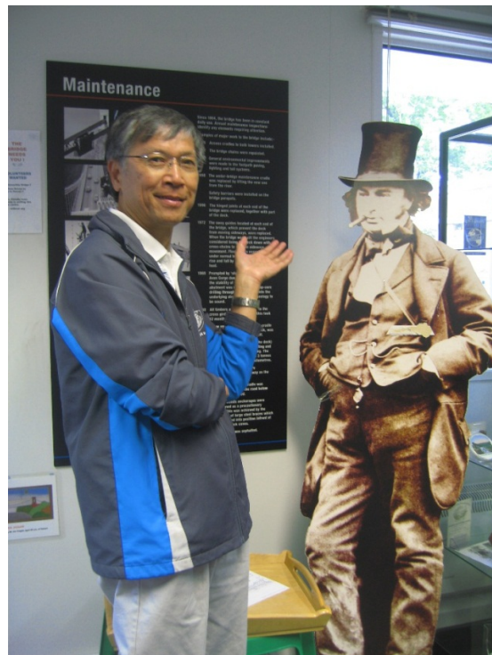
With the Picture of I. K. Brunel (Bristol, UK, 22 June 2013)

這位英國工程師就是伊桑巴德·金德姆·布魯內爾 (Isambard Kingdom Brunel, 1806-1859)。