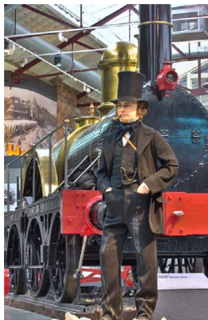
STEAM Railway Museum at Swindon, UK

今天英國各地都能看到有伊桑巴德·布魯內爾的雕像，特別是在 Swindon 的 STEAM 鐵路博物館裏，有他的栩栩如生的蠟像。有趣的是，美國有一間牛頓大學，澳洲有一間達爾文大學，唯獨英國自己沒有這兩間大學，卻有一間以布魯內爾命名的大學，位於英國倫敦西部，始於 1928 年，在 1966 年正式定名為布魯內爾大學 (Brunel University)。該校在英國大學排名不菲：體育管理第一、藝術與設計第二、電子與電腦工程通常排在前十名。