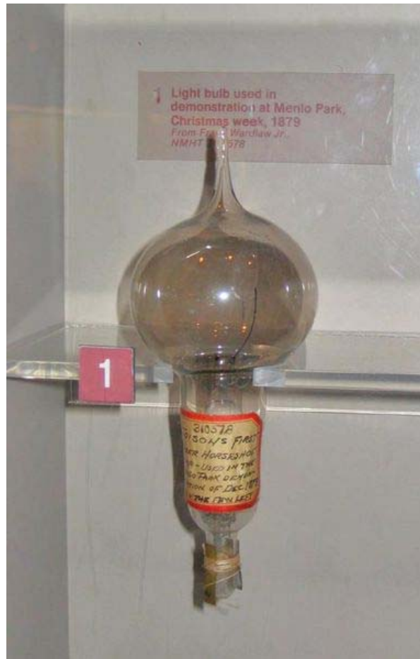
電燈泡（美國專利第 223898 號，1880 年）

愛迪生最成功和最為人們所熟識的發明當然是電燈泡了。1879 年 12 月 31 日，愛迪生在新澤西州的 Menlo Park 實驗室第一次公開演示了白熾電燈泡。當時，他甚至期望“把用電變得很便宜，便宜到只有富人才會去點蠟燭。”在 1880 年 1 月 27 日，他為這項偉大發明申報了美國專利。