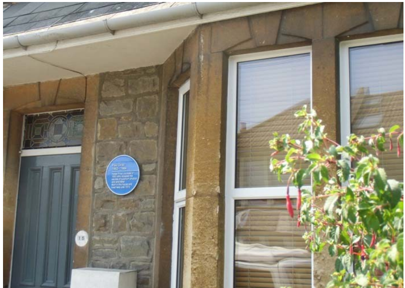
Home of Paul Dirac, Bristol, UK