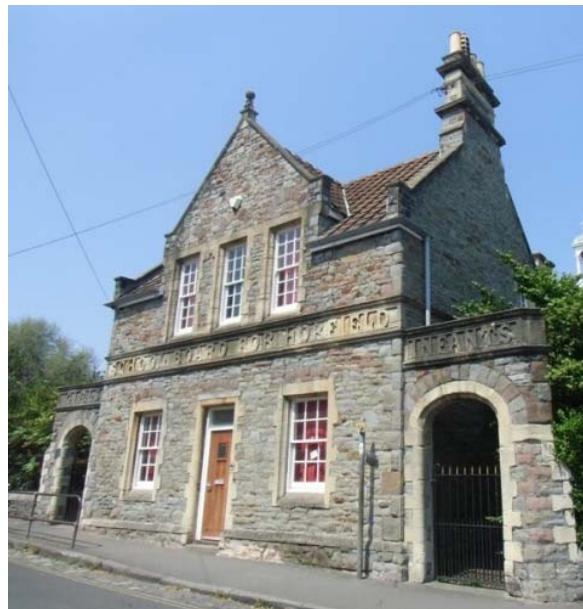
Bishop Road Primary School, Bristol, UK