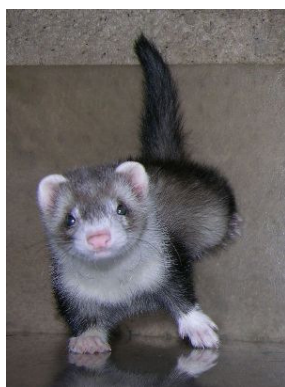
樹鼩 (tree shrew)