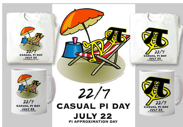
（每年7月22日是“ \pi 近似日”）

生日。2009年3月11日，美國眾議院還通過了一項決議，把3月14日正式確定為全國的“ \pi 日”（National Pi Day）。更有趣的是，麻省理工學院的招生辦公室每年都把新生錄取通知書留到 \pi 日才發送給新生。現在網絡通信方便了，還有傳聞說那裏的工作人員安裝了個電腦程式等到3月14日下午1時59分26秒才從網上把錄取通知向全世界發放出去，對應於 \pi \approx 3.1415926 。另外，因為 22/7 是比 3.14 對 \pi 更為精確的近似，每年7月22日也被公認為“ \pi 近似日”。