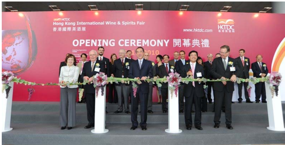
(2010 年香港國際美酒展，香港國際會議展覽中心，11 月 4-6 日)

在不知不覺之中，喝葡萄酒特別是葡萄紅酒成為了香港文化的一個重要組成部分。從 2008 年起，每年由香港貿易發展局主辦一屆國際美酒展，11 月 4-6 日在香港國際會議展覽中心隆重舉行。今年有來自六大洲 28 個國家和地區的 700 多商家參展。香港品質保證局今年還推出了首個“葡萄酒儲存管理體系認證”計劃。香港大學今年春天開始首辦了一個“葡萄酒業工商管理碩士”專業。呵呵，一發而不可收拾了。