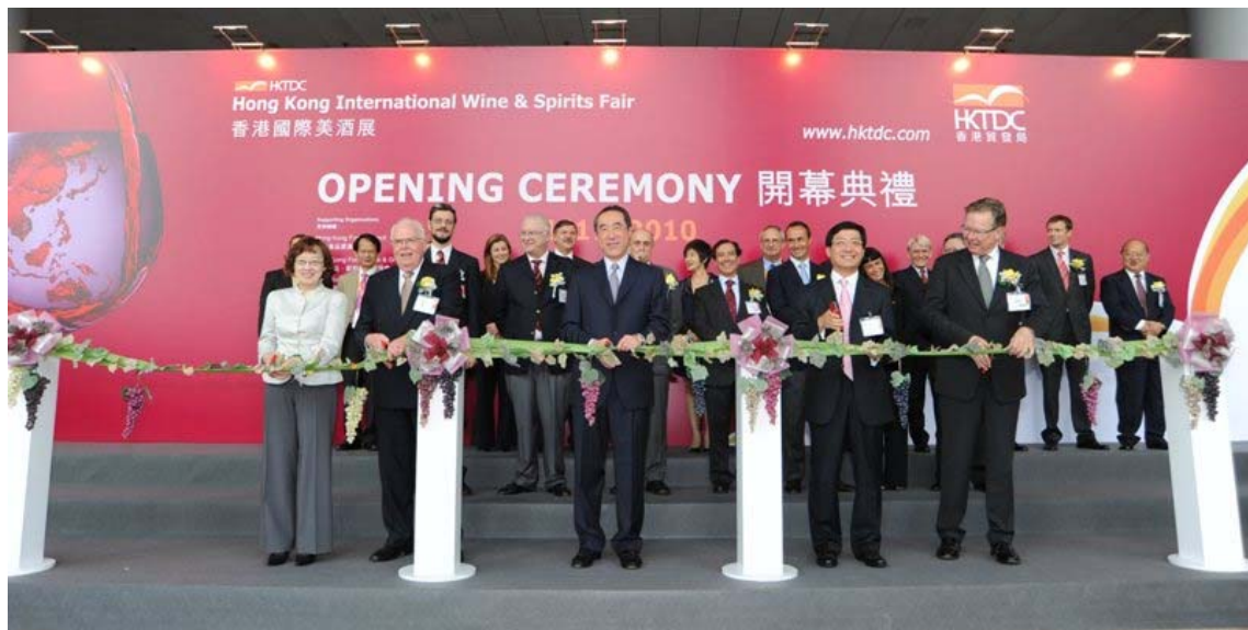
(2010 年香港国际美酒展，香港国际会议展览中心，11 月 4-6 日)

在不知不觉之中，喝葡萄酒特别是葡萄红酒成为了香港文化的一个重要组成部分。从 2008 年起，每年由香港贸易发展局主办一届国际美酒展，11 月 4-6 日在香港国际会议展览中心隆重举行。今年有来自六大洲 28 个国家和地区的 700 多商家参展。香港品质保证局今年还推出了首个“葡萄酒储存管理体系认证”计划。香港大学今年春天开始首办了一个“葡萄酒业工商管理硕士”专业。呵呵，一发而不可收拾了。