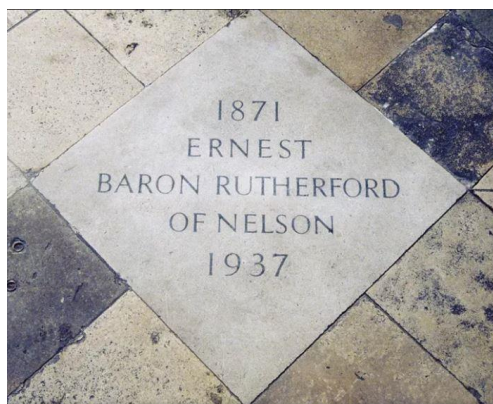
盧瑟福在 Westminster Abbey 的墓碑

對於這位偉大科學家盧瑟福的人品，後人有一句簡短的評語：「他從來沒有樹立過一個敵人，也從來沒有失去過一個朋友」。