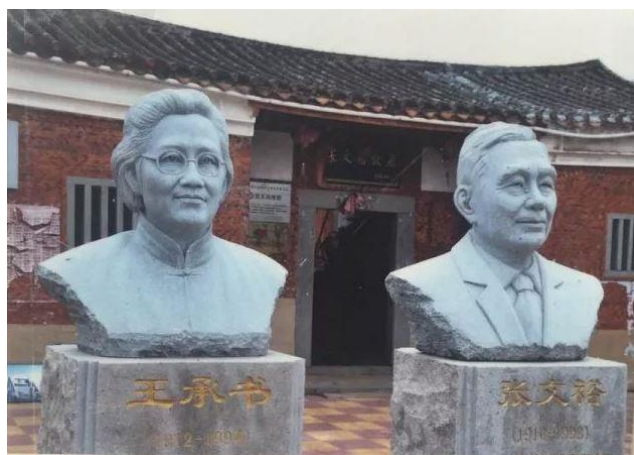
張文裕王承書夫婦在福建泉州的故居博物館

我國高能物理學家張文裕（1910年1月9日-1992年11月5日），1931年畢業於燕京大學物理系，1934年作為第三屆英國庚子賠款公費赴英留學，在劍橋大學師從盧瑟福，1938年獲博士學位，回國後於1957年被遴選為中國科學院學部委員即院士。他的夫人王承書院士（1912年6月26日-1994年6月18日）也為國人熟識。她1934年畢業於燕京大學物理系，1944年獲美國密歇根大學博士學位，1956年回國，後來為祖國研製原子彈隱姓埋名三十年。