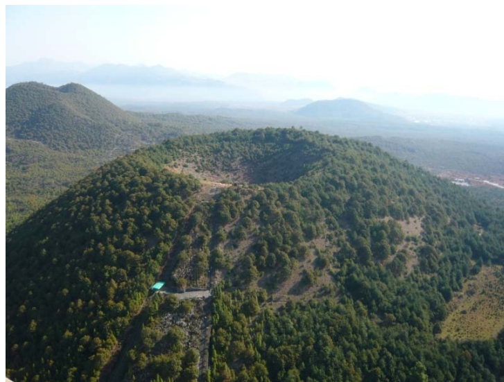
(腾冲火山国家公园)

腾冲素享「地热之乡」的美誉，自称有 99 座火山和 88 处温泉 — 只是他人无从核实，游客通常只见到其中的三三两两 — 这里据说还是中国唯一的火山地热并存地域。腾冲火山温泉地域规模宏大、景观神奇，著名的景点有火山国家公园、热海大滚锅、万年哈蟆嘴、怀胎奇井、美女仙池、醉鸟神泉、扯雀魔塘…。种种奇观妙景，展现出国家级风景名胜区的千姿百态和无穷奥秘。大自然的鬼斧神工，在这里还打造出不少火山地质奇迹，包括神柱谷、北海湿地、叠水河瀑布、坝派巨泉和黑鱼暗河等风景点。此地有许多参天拨地的大树，诸如杜鹃之王、秃杉之王、银杏之王，不一而足；当然，这里还有云南山茶的始祖和许多稀世珍禽异兽。特别是，腾冲近年新建了众多温泉旅舍，成就了一个自然风光与历史文化兼备的旅游胜地。