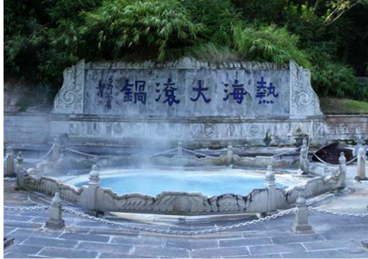
(腾冲热海温泉的大滚锅泉眼)

说到旅游，不能不提到明朝的地理学家、旅行家和文学家徐霞客（1586—1641）。他在经历了三十多年考察后撰成的 60 万字的《徐霞客游记》中，称赞腾冲为「极边第一城」。他发现云南各地佛寺居多，唯独腾冲例外，此处道观比寺庙更多。事实上，道教在腾冲有非常悠久的历史，那里的云峰山便是著名的道教圣地。