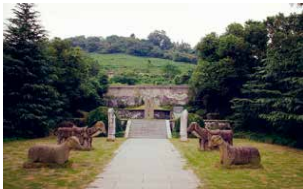
杭州余杭区良渚镇沈括墓